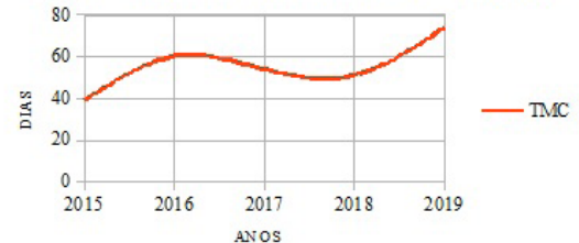
Gráfico 1 - Evolução do Tempo Médio de Concessão (TMC)